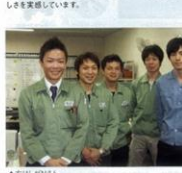
▲左起:設計課、開発課、生産課のメンバー