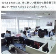
▲左起:設計課、開発課、生産課のメンバー